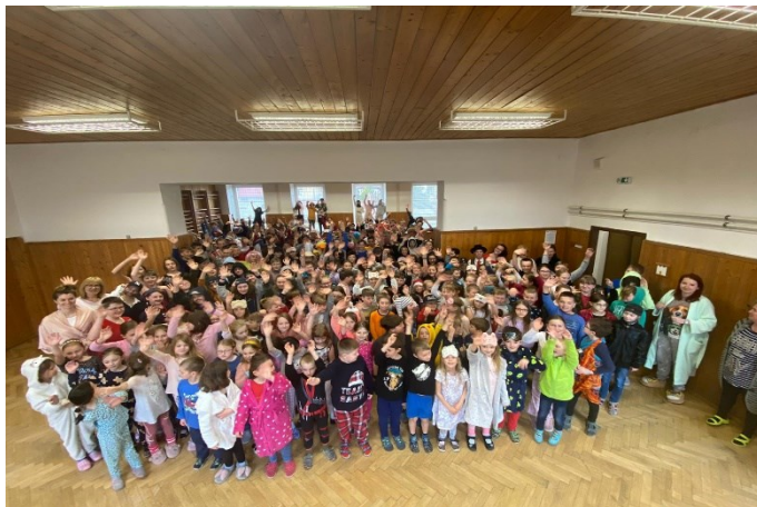
Den na ruby /pyžamový den/

Viz. příloha č. 4 - Hodnocení práce výchovné poradkyně