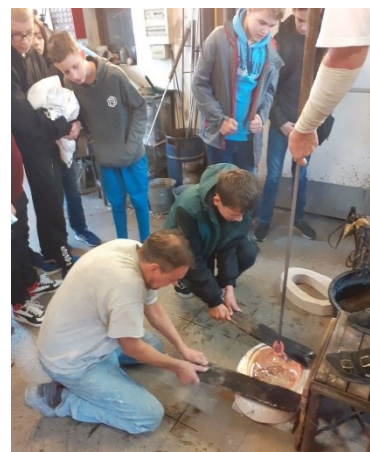
Sklo v našem životě