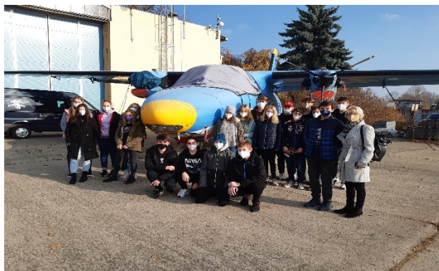
Letiště v Pardubicích I

Výlety jednotlivých tříd zaměřené většinou na turistiku a vlastivědu.