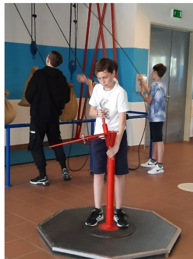
Exkurze Technické muzeum Brno